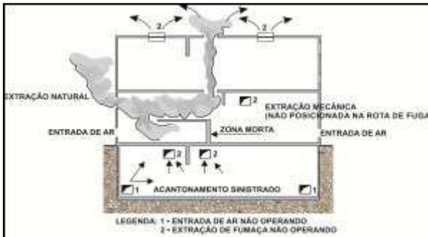
Figura 2 – Zonas mortas