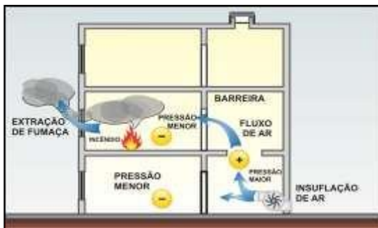
Figura 3 – Diferencial de Pressão

4.1.3 O controle de fumaça é obtido pela introdução de ar limpo e pela extração de fumaça, pelos seguintes tipos de sistemas, conforme Tabela 1.