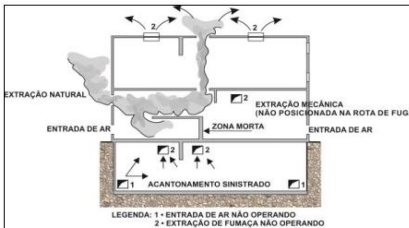
Figura 2 - Zonas mortas

b) Extração adequada da fumaça, não permitindo a criação de zonas mortas onde a fumaça possa vir a ficar acumulada, após o sistema entrar em funcionamento (ver Figura 2);