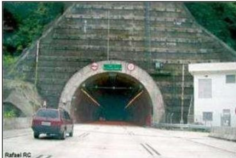
Figura 2 - Sinalização na entrada do túnel

5.10.2 Para os túneis acima de 1.000 m, devem ser instalados painéis internos eletrônicos a cada 500 m, indicando as condições de segurança no túnel.