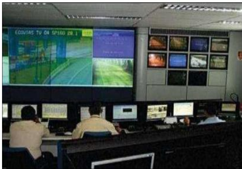
Figura 3 - Central de monitoramento

5.11.4 A central de monitoramento (controladora) do sistema de circuito interno de TV deve ter vigilância habilitada durante todo o período de funcionamento diário do túnel.